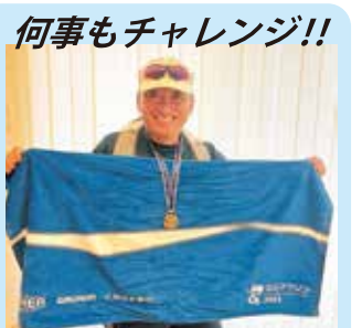
何事もチャレンジ!! 人生初のフルマラソンに挑戦富山マラソン無事に完走