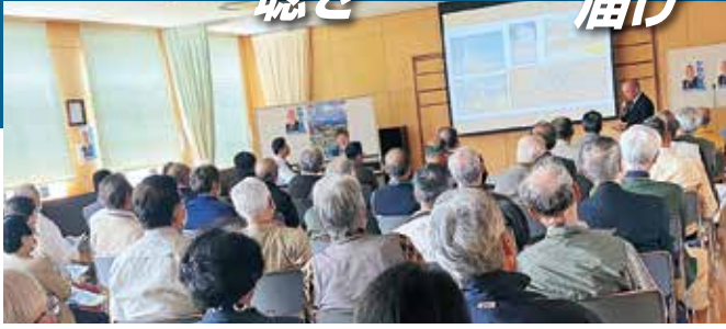
10月14日 市政報告会を開催多くの皆様にご参加いただきありがとうございました。