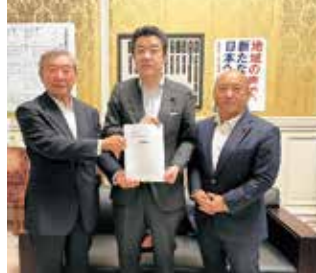
野上県連会長へ都市計画道路金屋線と神通川護岸工事の要望