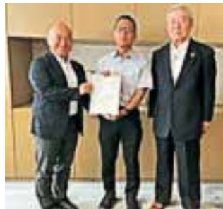
今後の高山線活性化について副市長に要望