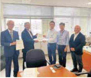
西富山駅の駅のホーム新設に関して振興会長けやき台町内会長とともに要望