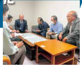
金屋町内会の皆様と企業団地からの悪臭について要望