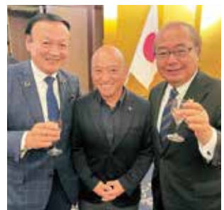
新田知事藤井市長とスリーショット