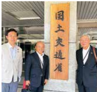
今後の五福地内の事業について国土交通省へ振興会長と要望活動