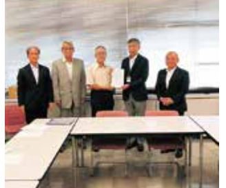
桜谷振興会長と安養坊町内会長とともに市道の融雪装置の改善要望に