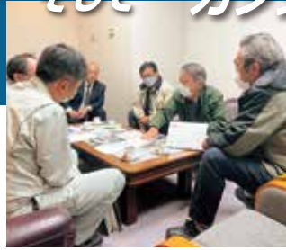
下野新町内会の皆様と7月の大雨の被害と今後の対策について要望